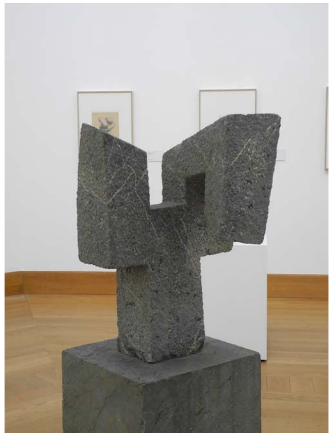
Monumento a Fleming, Granit, 1955

Wenn er sich selbst einmal als »Architekt der Leere« (so der Titel der Wiesbadener Ausstellung) bezeichnet, so spiegelt sich darin auch sein biografischer Weg, der Chillida über die Architektur zur Bildhauerei führte und von dort wieder zur Architektur – »eine Kunst, die mich heute viel mehr interessiert als damals«, wie er im Rückblick konstatierte (S. 141). In seiner Pariser Studienzeit 1948-1951 ließ er sich von der griechischen Plastik im Louvre ebenso wie von Hölderlins Gedichten inspirieren. 6 Die Zeichnungen und Skulpturen dieser Jahre setzen einfache Körpervolumina miteinander in ein Verhältnis, die wie von außen konstruiert erscheinen. »Das Volumen, das den Raum ausschloss, bedeutete mir viel. Aber irgendetwas fehlt. Wie sollte ich es diesen festen Körpern einfügen, bei denen sich alles auf der Oberfläche abspielte? Ich suchte etwas anderes. Was? Ich wusste es