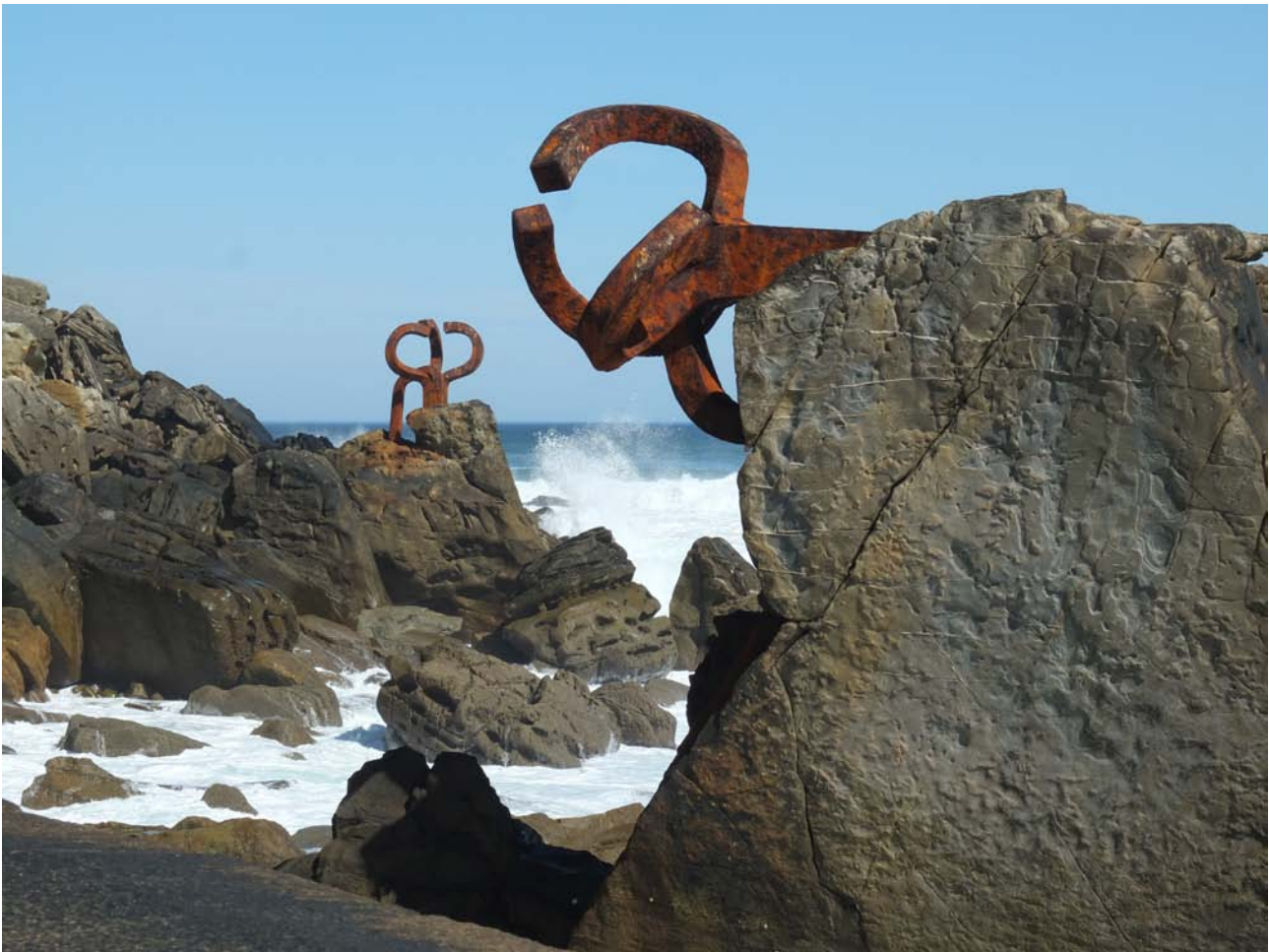
Peine del viento XV (Windkämme XV), 1975-77.

die Basken und ihr Land, das zwischen zwei Extremen liegt – dem Punkt, an dem die Pyrenäen enden und der Ozean beginnt». 2