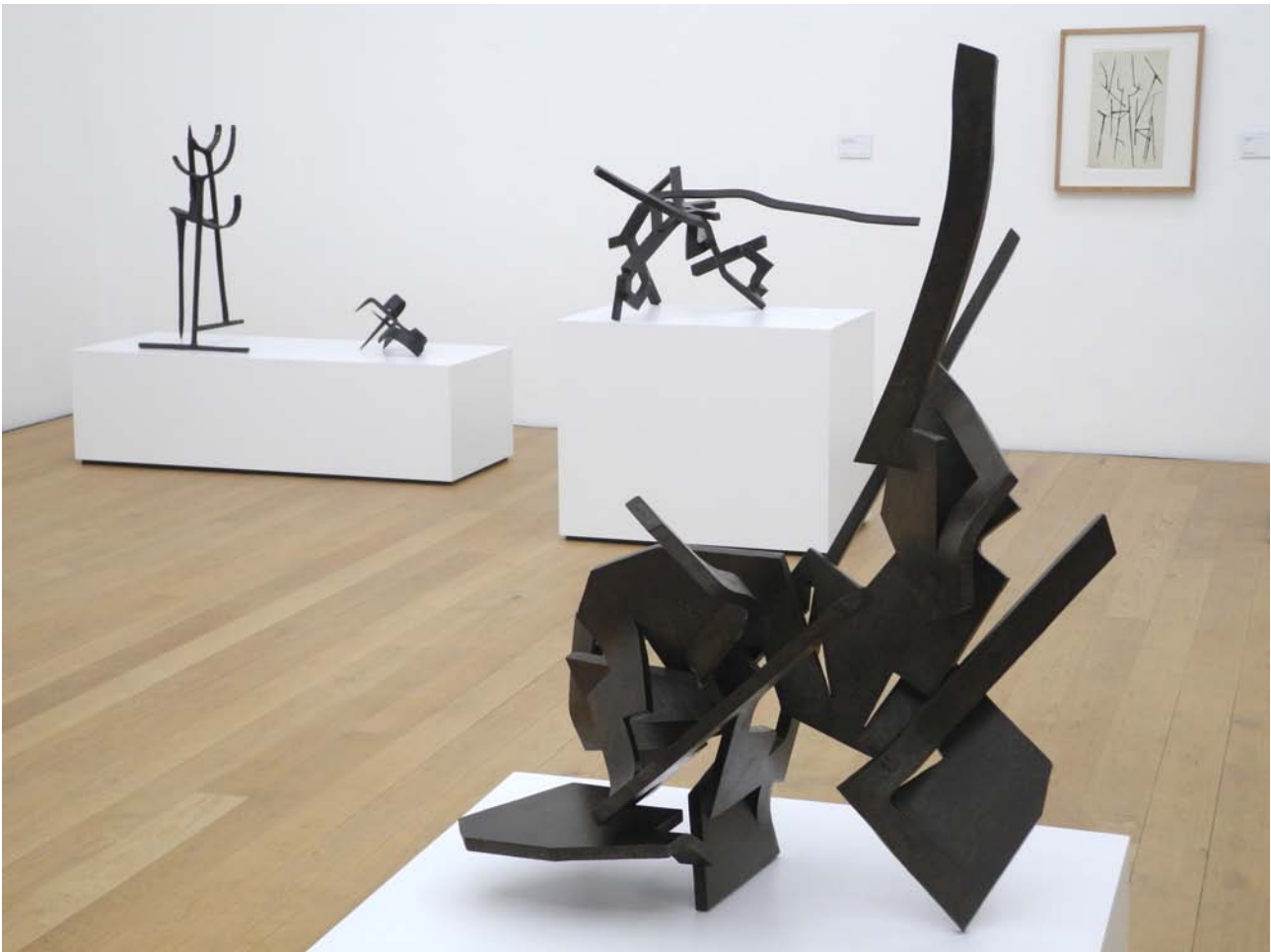
Rumor de limites VI, Eisen, 1960, Colección Alicia Koplowitz – Grupo Omega Capital

die Schwelle dazwischen zu erleben, die mich in meiner innersten Existenz berührt. Dies geschieht wie absichtslos, ganz aus der ›Sache‹ heraus. Und gerade darin scheint mir etwas sehr Zukunftsweisendes zu liegen.