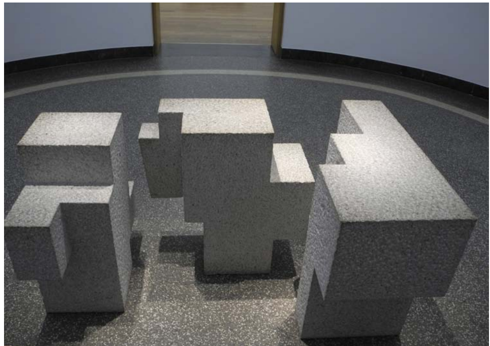
Gurutz Aldare, Granit, 2000, Kunststation Sankt Peter, Köln

es diesem Umstand zu verdanken, dass sie nun nach Wiesbaden ausgeliehen werden konnte.