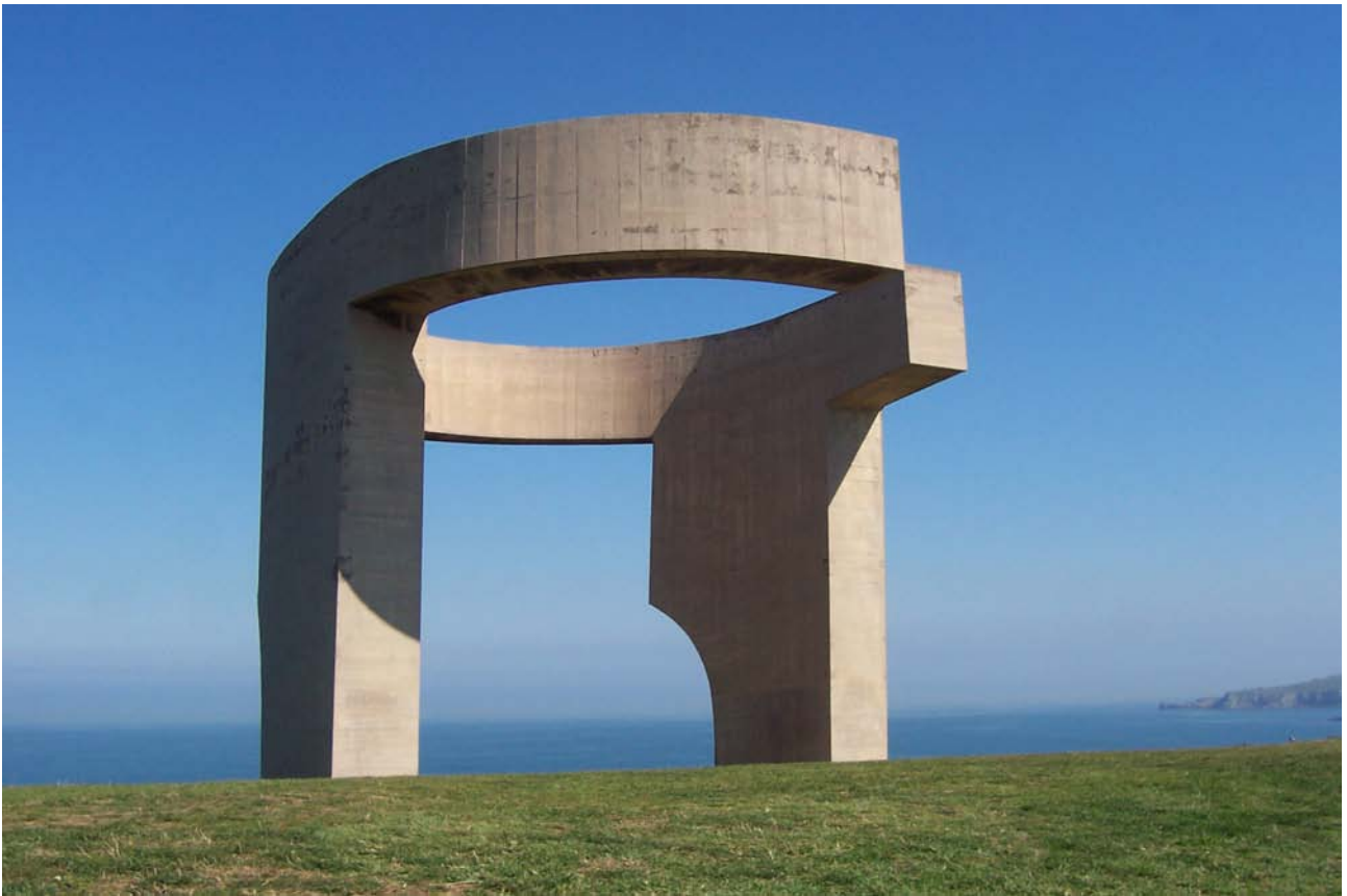
Elogio del Horizonte, Beton, 1990, Gijon/Nordspanien, Höhe: 10 m.

entsteht hier vor allem durch die Gesten der sich einander zuwendenden Bögen. Zum Apsisrund hin steigen die Wände höher an und bergen mich gegenüber der äußeren Welt. Nur der Himmel wölbt sich über mir – und nach vorne öffnet sich der Blick ins Freie durch einen breiten Einschnitt bis auf Brusthöhe. Seitlich wird er flankiert von den besagten nach vorne-oben sich öffnenden ›Luftgreifern‹, die mir nun wie die Erweiterung meiner Wahrnehmungsorgane erscheinen.