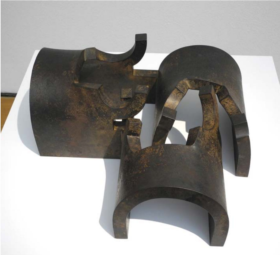
La casa de J. S. Bach, Cortenstahl, 1980, Museo Nacional Centro de Arte Reina Sofía, Madrid

»Nichts ist drinnen, nichts ist draußen; / Denn was innen, das ist außen. / So ergreift ohne Säumnis / Heilig öffentlich Geheimnis!«