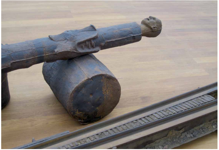
Joseph Beuys: Die «niedergelegte» «Straßenbahnhaltestelle», 1976 (Detail) in der Nationalgalerie für Gegenwartskunst Berlin – Hamburger Bahnhof.

Als ein solches bezeichnete Joseph Beuys seine 1976 auf der Biennale von Venedig errichtete «Straßenbahnhaltestelle»: ein aufgerichtetes Kanonenrohr, aus dem ein menschlicher Kopf ragt, ein liegendes