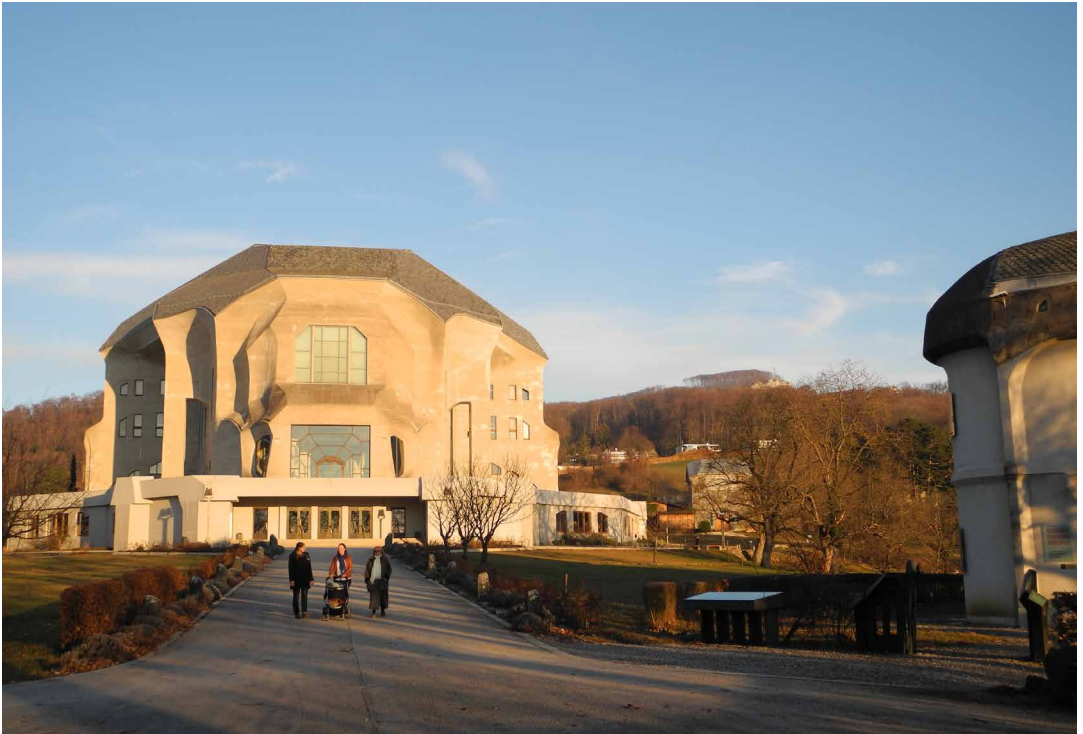
2. Goetheanum von Westen