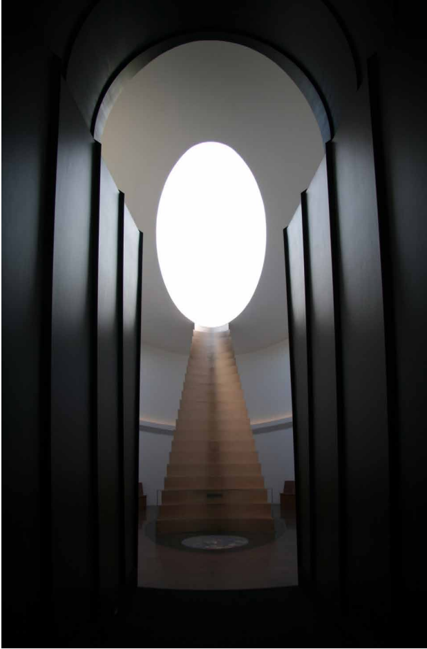
James Turrell: Roden-Crater, Ost-Tunnel

des Goetheanums selbstverständlich kannte, 17 bei seiner teils ebenfalls aus Stahlbeton errichteten Kapelle Notre-Dame-du-Haut in Ronchamp (1950–53) eindrucksvoll auf. Auch hier umschließen Wände und Dach einen Hohlraum, der durch gezielte Durchbrüche ein besonderes Lichterleben ermöglicht.