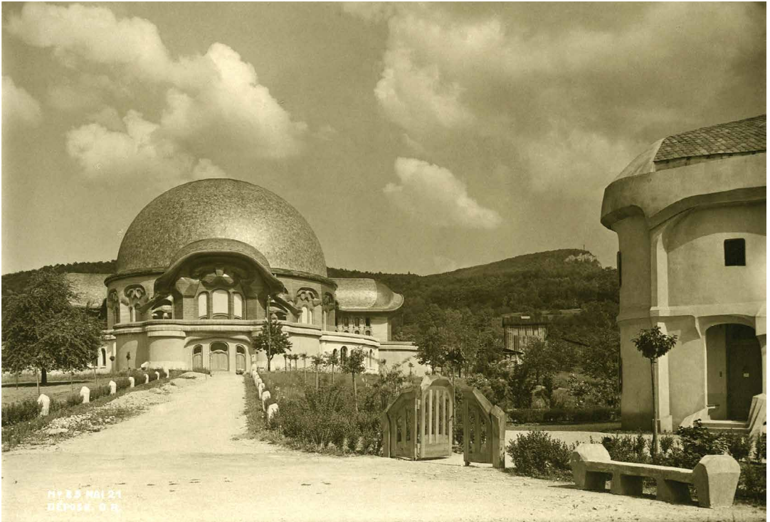
1. Goetheanum von Westen

Entwicklung im Verständnis von Goethe und Steiner liegt immer ein geistiges Urbild zugrunde, das prinzipielle Möglichkeiten umfasst, die sich zwischen polaren Kräften entfalten können. Was in die äußere Erscheinung tritt, ist nie nur Verwirklichung einer Idee, sondern dient der Erfahrung eines Geistigen im Irdischen. Die sich dabei bildenden Keime ermöglichen neue, andersartige Erscheinungen. Dieses Prinzip der Folge ist Kern von Goethes Metamorphosenlehre: Im Wechselspiel von Zusammenziehung und Ausdehnung tritt als Steigerung die Blüte in Erscheinung, in deren Zentrum sich Frucht und Samen für einen weiteren Neubeginn ausbilden.